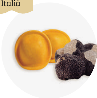
Lunette al tartufo