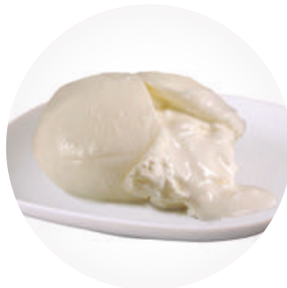
Burrata 125 g