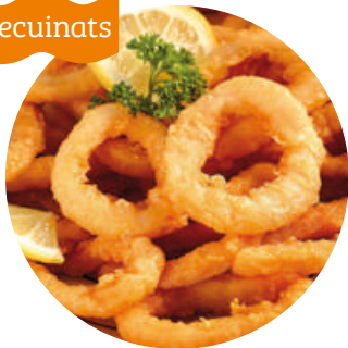
Anella romana compas