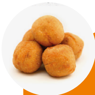
Croqueta de xoriç, camembert i mel