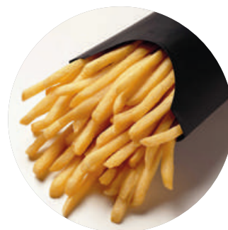
Patata selecta 9x9

El contrast irresistible entre intensitat, cremositat i dolçor!