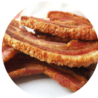
Torrezno de Soria